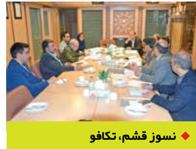
نسوز قشم، توکا