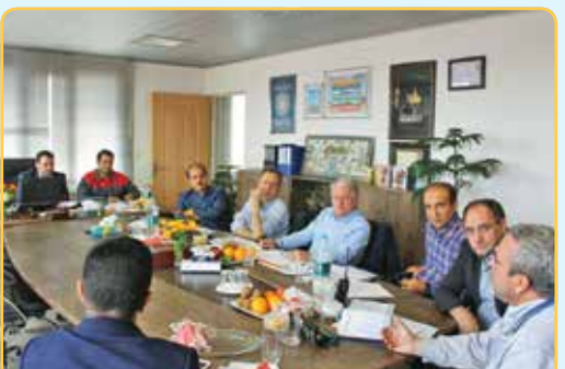
جلسه مذاکرات فنی با شرکت PARFER SITI ایتالیا در راستای طرح توسعه شرکت فولاد کالا فوکا