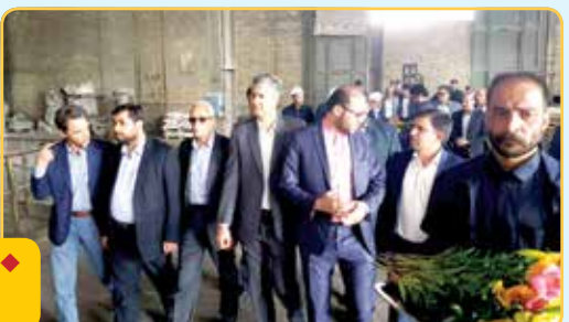
بازدید فرماندار محترم شهرستان لنجان و امام جمعه محترم به مناسبت هفته کارگر از شرکت فراورده‌های نسوز آذر