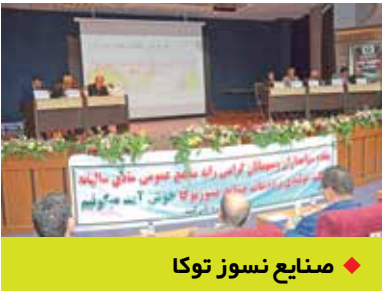
صنایع نسوز توکا