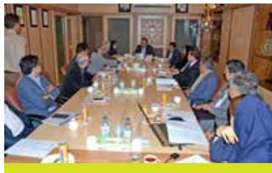
امواج طلایی، توکا سیر