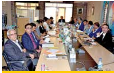
بهسازان صنایع خاورمیانه