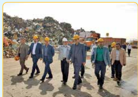
با حضور رئیس ستاد مدیریت حمل و نقل کشور از مرکز اسقاط خودرو با ظرفیت ۳۰ تن اسقاط در روز در شرکت فولادکالا زیرمجموعه هدینگ توکا فولاد در شهرک صنعتی رازی بهره‌برداری شد. با حضور رئیس ستاد مدیریت حمل و نقل کشور افتتاح شد مرکز اسقاط خودرو «فولاد کالا» نماد صنعت سبز ایران